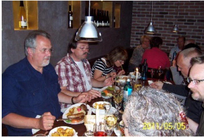
Reichlich Gesprächs-, Essens- und Trinkstoff in der Südpfalz.